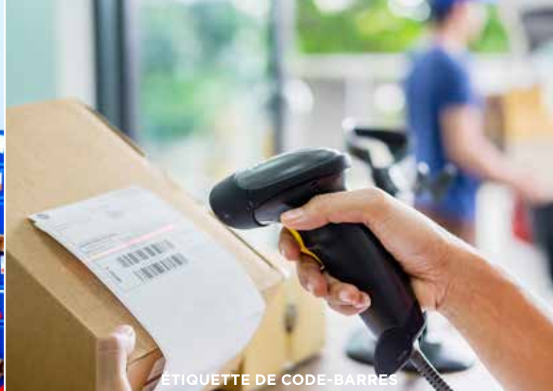
ÉTIQUETTE DE CODE-BARRES