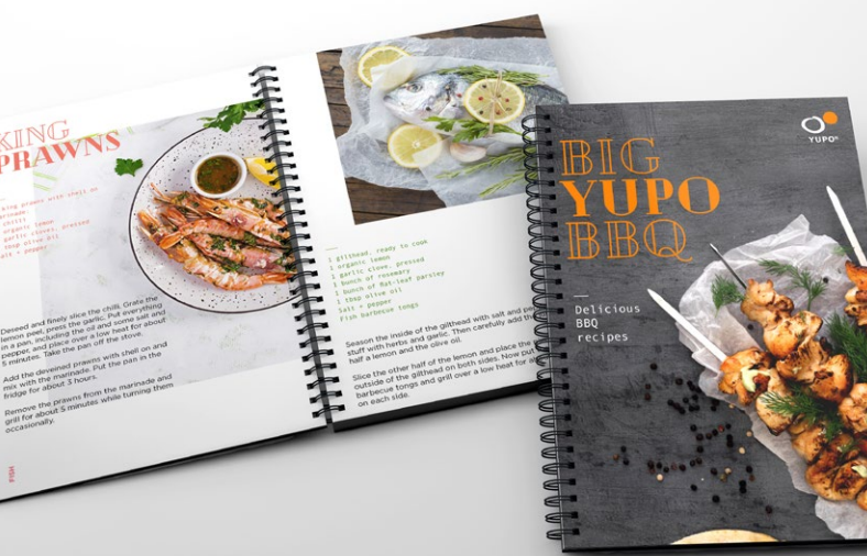
RICETTARIO SUPERYUPO FEBG 300