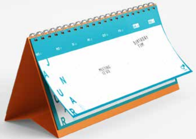
CALENDARIO DE ESCRITORIO SUPERYUPO FRBG 110