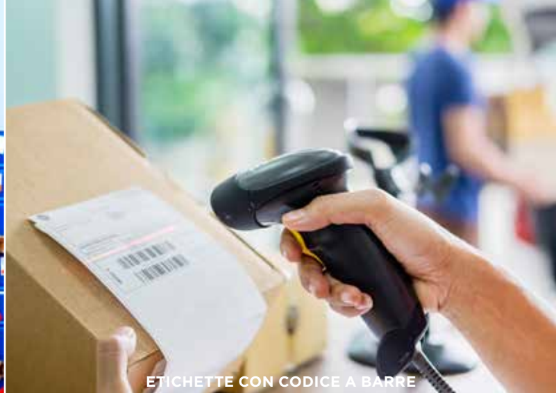
ETICHETTE CON CODICE A BARRE