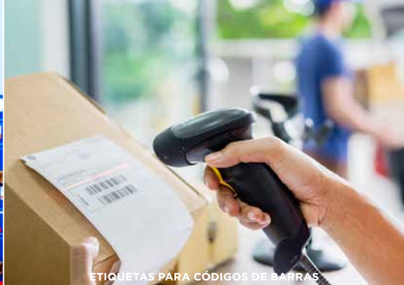
ETIQUETAS PARA CÓDIGOS DE BARRAS