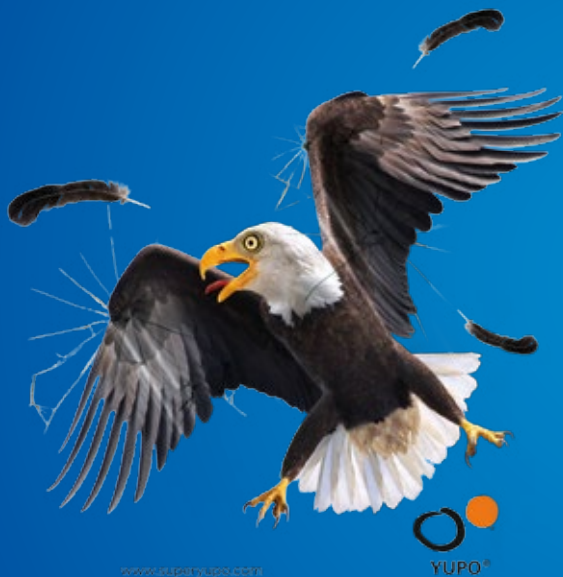
AUTOCOLLANT DE FENÊTRE YUPOJELLY®