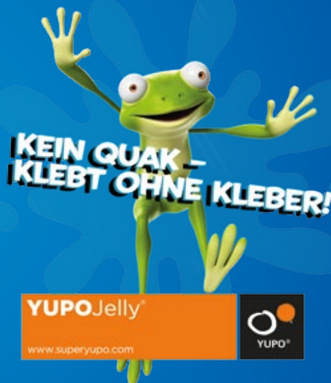
AUTOCOLLANT DE FENÊTRE YUPOJELLY®